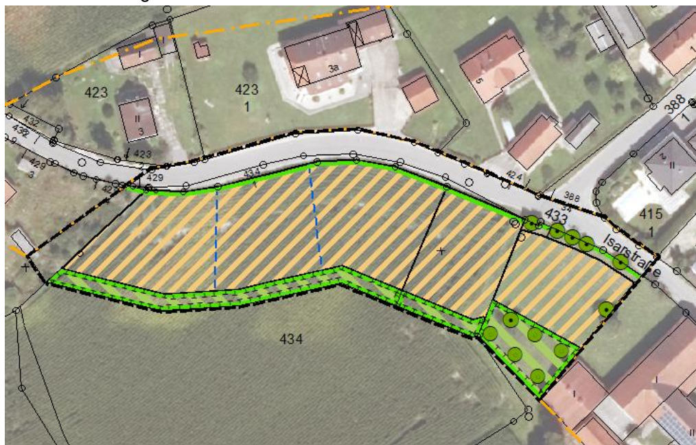
Darstellung unmaßstäblich [verändert]

Innerhalb des Geltungsbereiches der Einbeziehungssatzung „Isarstraße Süd 2025“ befinden sich die Flurnummern 429 (TF), 429/5, 433 (TF), 434 (TF), 434/1 und 421 (TF) der Gemarkung Bruckbergerau. Der Änderungsbereich der Flurnummer 434 ist in zwei Bereiche (A und B) geteilt. Bei dem Änderungsbereich A sollen drei Bebauungen möglich sein, beim Änderungsbereich B ist eine Bebauung angedacht. Der Änderungsbereich der Flurnummern 421 (Änderung C) ist ebenfalls für die Erweiterung mit einem Anwesen gedacht.