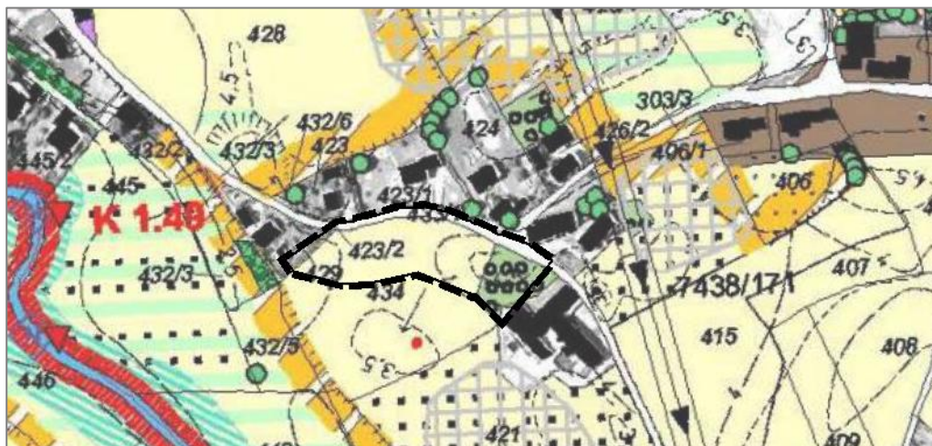
Abbildung: FNP Bruckberg, verändert KomPlan, Darstellung unmaßstäblich Nach dem Erlass der vorliegenden Einbeziehungssatzung sollte die Anpassung sowie die Aktualisierung des Flächennutzungsplanes der Gemeinde Bruckberg erfolgen.

Die Gemeinde Bruckberg besitzt einen rechtswirksamen Flächennutzungsplan. Die Änderungsbereiche der vorliegenden Einbeziehungssatzung werden größtenteils als Landwirtschaftliche Nutzfläche dargestellt. Östlich befindet sich eine Obstwiese.